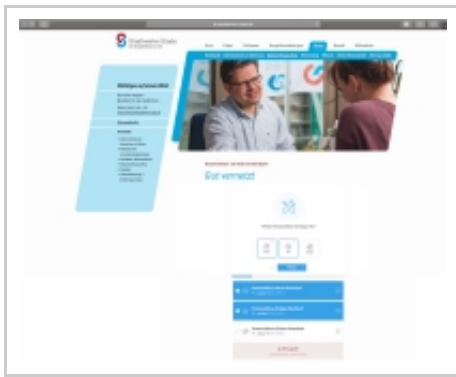
Hausanschluss einfach digital online abschließen

Die Stadtwerke Stade tun das, was in der Branche zwar bereits hinlänglich bekannt ist, aber nach wie vor nur recht zögernd umgesetzt wird: Den Kunden in den Fokus aller Bemühungen zu setzen. Der Versorger aus Niedersachsen hat mittlerweile nicht nur den Hausanschlussprozess für die Sparten Strom, Erdgas und Trinkwasser vollständig digitalisiert, sondern lässt nun auch seine Kunden an den Vorteilen des digitalen Handlings teilhaben: Denn diese können den Hausanschluss seit Kurzem mit wenigen Klicks ganz einfach und komfortabel online bestellen.