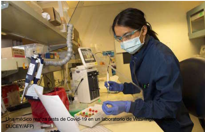
Una médico realiza tests de Covid-19 en un laboratorio de Washington.

Las autoridades sanitarias de Austria, uno de los países europeos que mejor ha gestionado la pandemia del coronavirus hasta el momento, han identificado a nivel global 155 potenciales medicamentos y 79 posibles sustancias prometedoras para una vacuna contra el Covid-19.