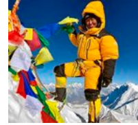
ahalduntzea Everest mendiaren magaletan

Austria, que se encuentra desde la semana pasada en fase de desconfinamiento, ha registrado hasta ahora en total unas 14 700 infecciones confirmadas con coronavirus, con 470 fallecidos.