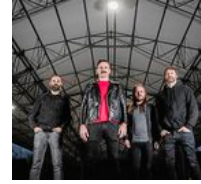
GARA Cobra: «Hemos integrado nuevos elementos y nos sentimos cómodos»