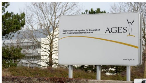
Eine ehemalige Pharmalobbyistin soll Chefin der Medizinmarktaufsicht in der AGES werden. (Symbolbild)

0 KOMMENTARE 29.01.2022 15:28 (Akt. 29.01.2022 15:28)